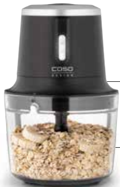
Kabelloser Multizerkleinerer: Cordless multi chopper: Chop & Go, Art.Nr. / Art.No. 1747

Serve the waffles with quark or a plant-based alternative and your favourite fruit.