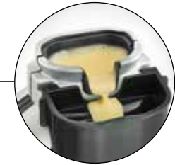
Einfüllöffnung für den Teig mit rückwärtig angebrachtem Auffangbehälter Filling opening for the dough with a drip container attached to the rear