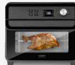
Air Fry Chef 1700, Art.Nr. 3180