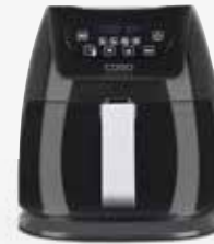
AF 250, Art.Nr. 3180