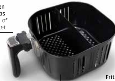
Frittierkorb Frying basket

Hinweis: AF 600 XL ohne Duplex-Trennwand / Note: AF 600 XL without duplex-divider