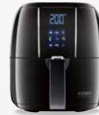
AF 200, Art.Nr. 3172