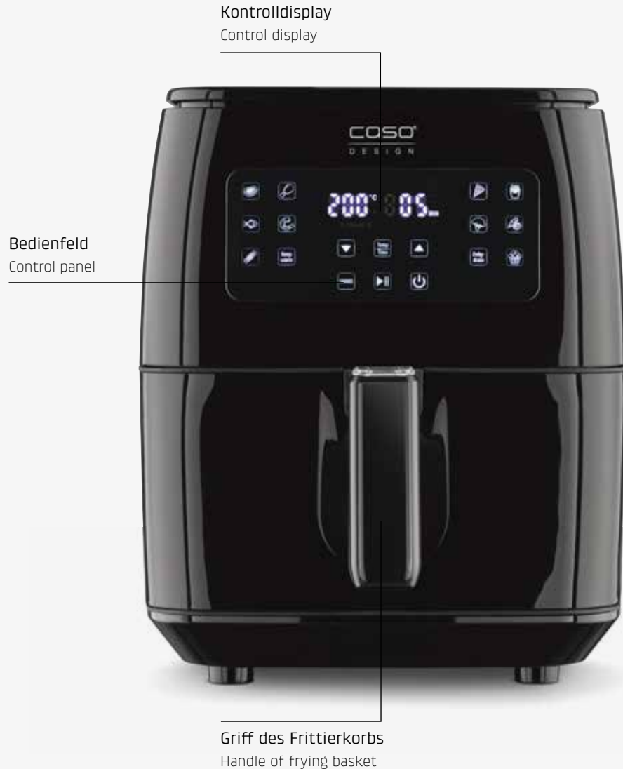
AF 600 XL, Art.Nr. 3180 AF 660 Duplex, Art.Nr. 3181